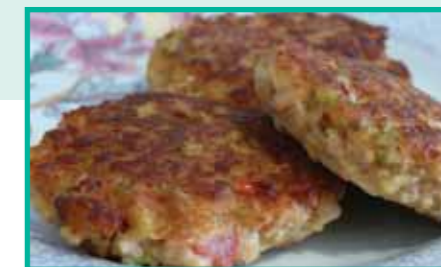
hambúrguer de soja

Evite o consumo de carne vermelha. Opte por peixes e varie o cardápio com receitas a base de proteína de soja.