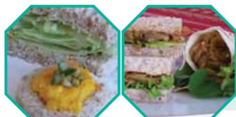
creme de ovo e cenoura

O problema é que, além de parecer gordura animal, que se solidifica dentro do organismo, durante o processo da hidrogenação das margarinas, são produzidas enormes quantidades de gorduras trans. Já foi cientificamente evidenciado que a gordura trans é a grande causadora da maioria das doenças ditas modernas, tais como hipertensão, diabetes, problemas cardíacos, esclerose etc.