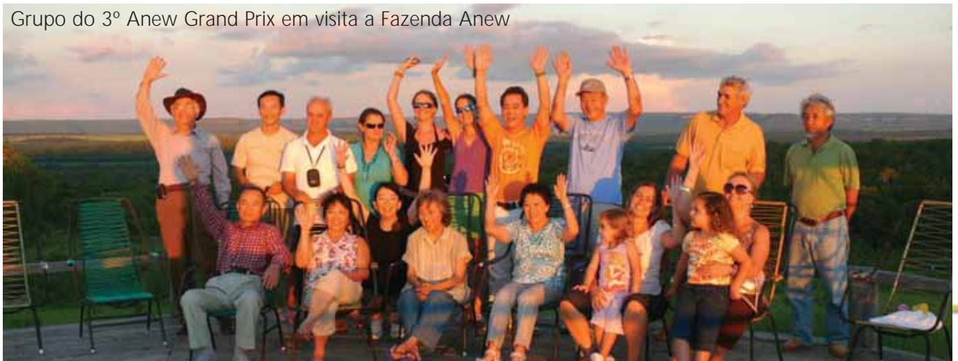
Grupo do 3º Anew Grand Prix em visita a Fazenda Anew