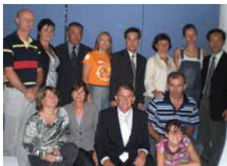
Santa Cruz do Sul